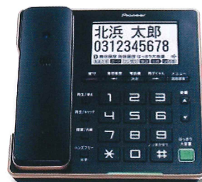
オンキヨー&パイオニア製：TF-FA75W