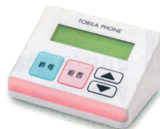
迷惑電話自動ブロック